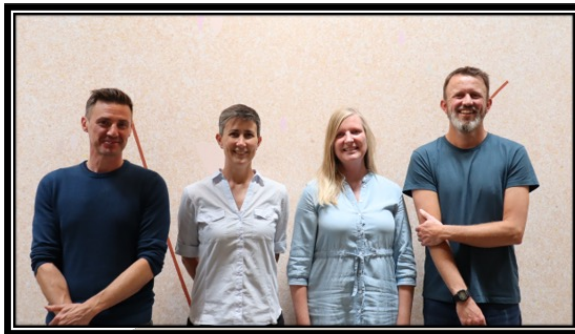
Studievejledningen på Skanderborg Gymnasium